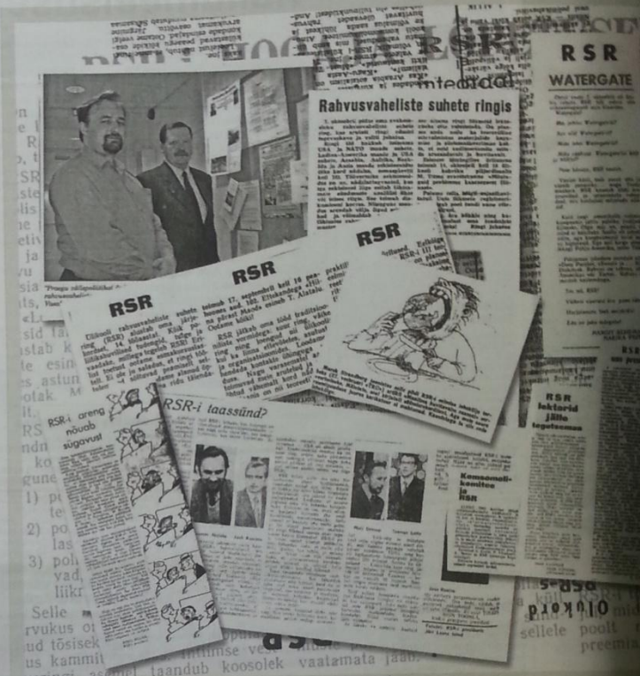
Valik ülikooli lehes avaldatud RSRi teemalisi artikleid aastast 1963–2003.

Nüüd on ringi roll paljuski muutunud. Selle asemel, et ise ettekandeid teha, kutsuvad RSRlased igapäevastele koosviimistele rääkima spetsialiste ja põnevaks aruteluks läheb tavaliselt alles pärast esineja kõne lõppemist, kui tudengitel õlleklaas lõpuni joodud.